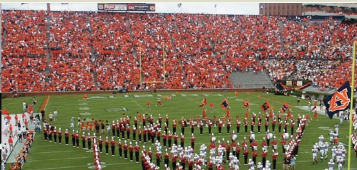
Ligue : La Picardie vers l'International