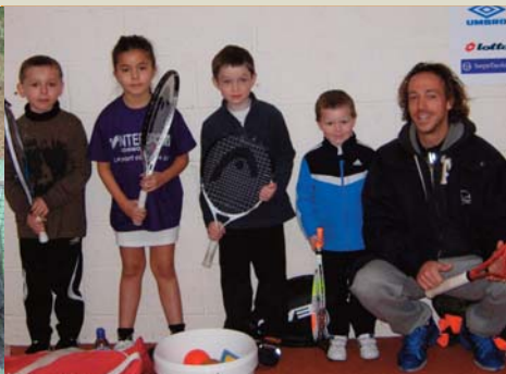
Comité Aisne: Détections à Vivaise