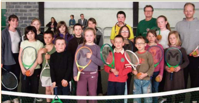
Comité Somme Animation à Moislains