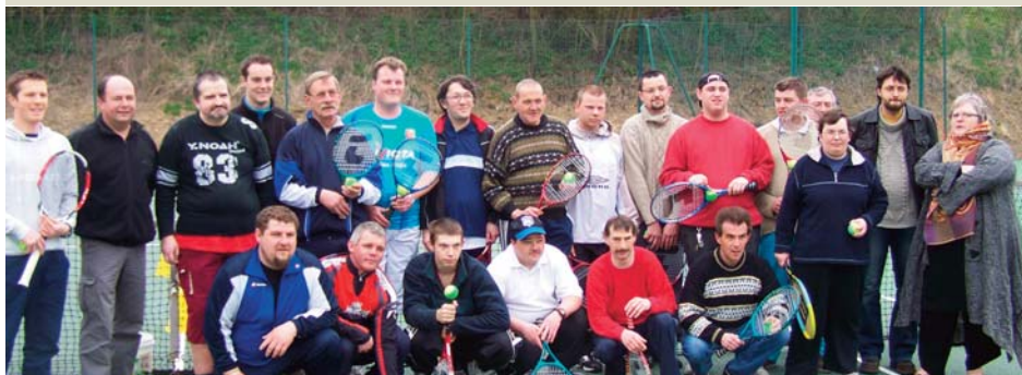
Comité Aisne : Initiatives à Viry Noureuil